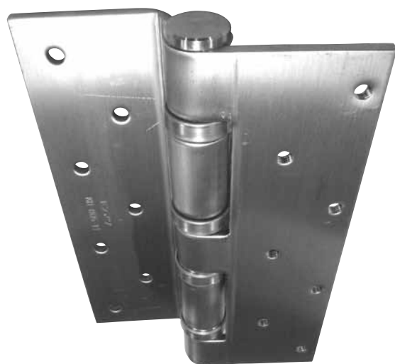
BB大型丁番杵側タップタイプ