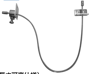
ワイヤーストッパー(長さ可変仕様)